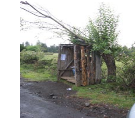
Paradero sector Quelhue