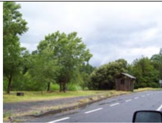
Paradero Camino Internacional