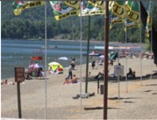
Señalética playa Caburgua