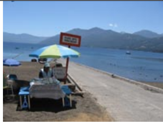
Señalética playa Caburgua