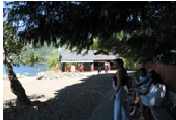
Escaños playa Caburgua