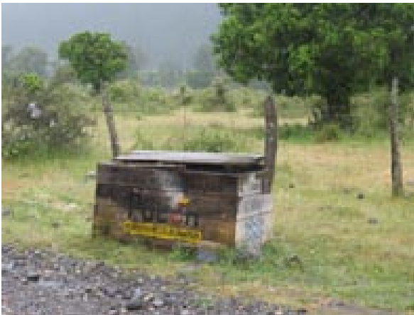
Basurero sector Quelhue