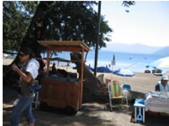
Quioscos playa Negra Caburgua