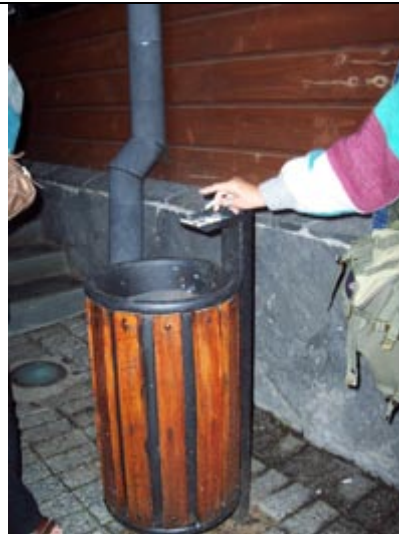
Basurero Edificio Municipalidad