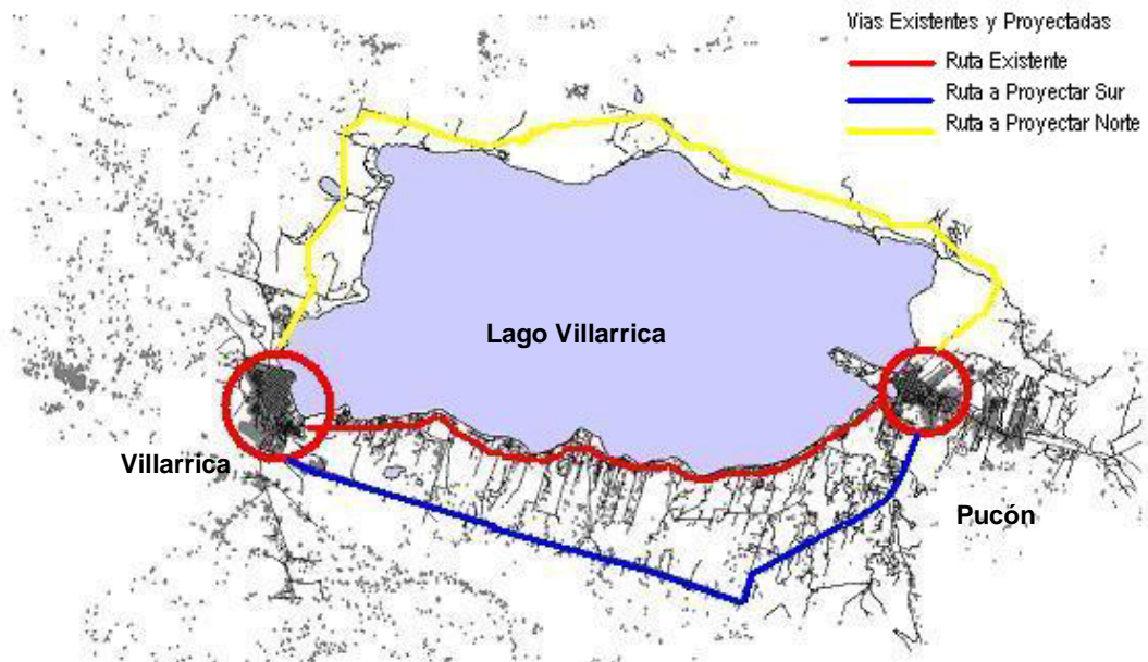
ESQUEMA 4.1. a, VIAS EXISTENTES Y POSIBLES ENTRE INTERCOMUNA VILLARRICA - PUCÓN